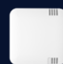
Sensor temperatur och fukt inomhus