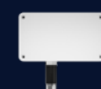
Sensor temperatur/ fukt utomhus